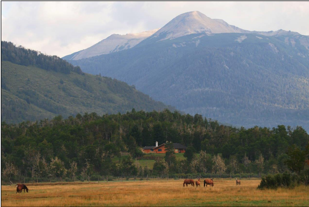
„Jagdlodge mit dem Revier im Hintergrund!“