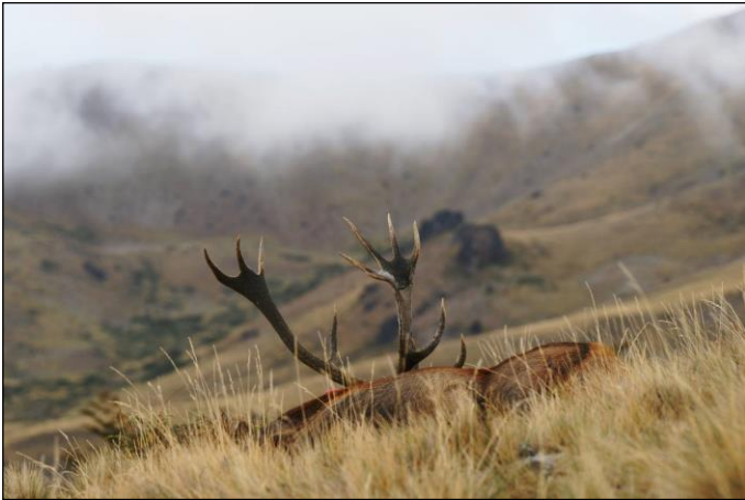
„Der alte Recke liegt im Feuer!“