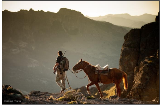
„Manchmal muss das Pferd auch geführt werden!“