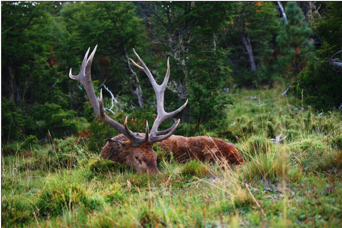
„Hochkapitaler Berghirsch, erlegt nach spannender Pirsch!“

Das Rotwild wurde um 1900 aus Europa kommend in verschiedenen Landesteilen Argentiniens ausgewildert. Das günstige Klima und die Äsungsverhältnisse sagten dem Rotwild sehr zu, so dass sich hier ein ausgezeichneter Bestand entwickeln konnte. Viele Jäger aus der ganzen Welt konnten bereits hervorragende Trophäen erbeuten. Die besten Bestände gibt es in den Anden und in der Pampa-Region wobei die Hirsche in den Anden stärkere Trophäen aufweisen.