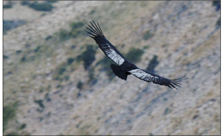
„Der Condor zieht seine Kreise im Revier!“