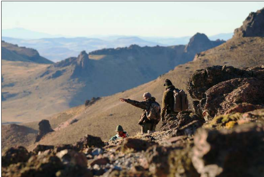
„Erfahrene Jagdführer begleiten Sie!“

Weitere Informationen sowie detaillierte Angebote auf Anfrage! (Auch Flugangebote, evtl. Visum, Hilfe bei Waffen- und Trophäeneinfuhr) Kontaktieren Sie uns!