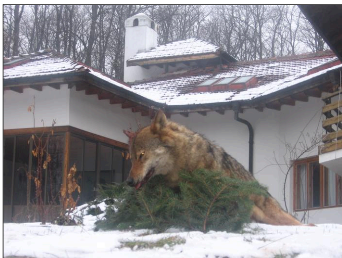
„Der graue Räuber liegt!“

Bulgarien hat ca. 7,9 Millionen Einwohner. Bevölkerungsdichte ca. 71,2 Menschen je Quadratkilometer (Deutschland ca. 229, Österreich ca. 86, Schweiz ca. 154). Orthodoxe Christen sind 85 %, Muslime – 13 %, andere 2 %. 88% der Gesamtbevölkerung sind Bulgaren, 8% sind Türken, 2 % sind Zigeuner und 2 % sind Rumänen, Armenier und andere Nationalitäten.