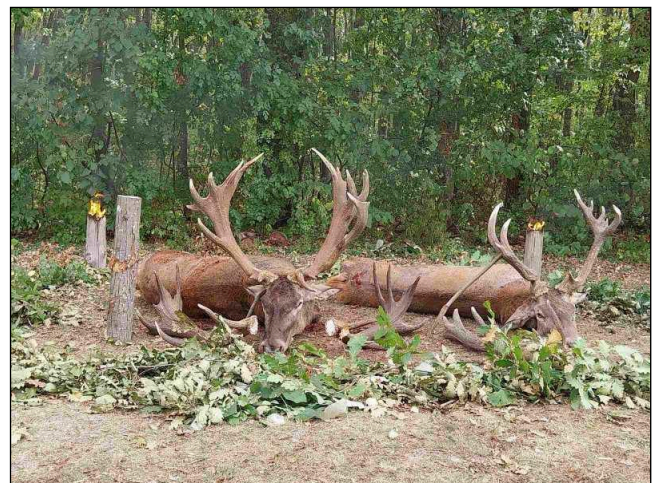
„Zwei brave Recke aus dem Nordosten Bulgariens!“