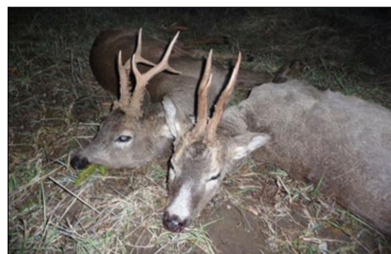
„Doppeltes Weidmannsheil nach einer Abendpirsch!“