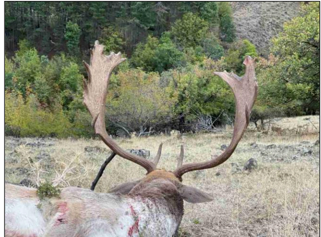
„Die Damhirschjagd in Bulgarien hat ein gewisses Bergjagd-Feeling!“

Trophäen mit über 200 CIC-Punkten werden mit 10 % Preiszuschlag berechnet.