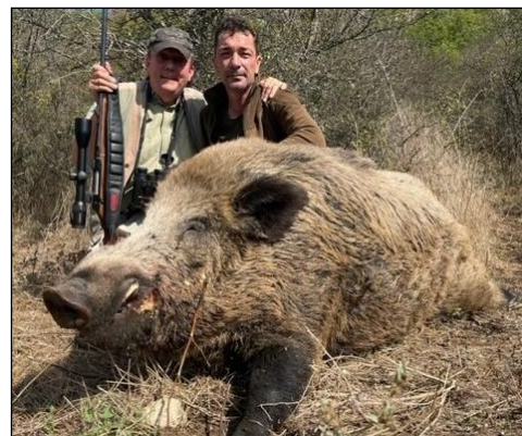
„Dieser Keiler wurde während der Hirschbrunft erlegt!“