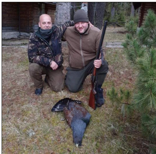
„Starker Urhahn aus den Rhodopen!“