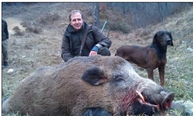
„Dank des treuen Schweißhundes, wurde dieser Brocken gefunden!“