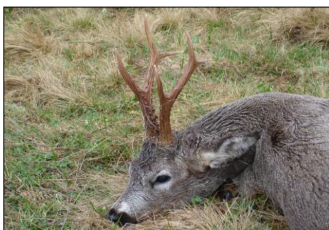
„Rehbock mit über 400 g aus dem Revier Tschepino!“