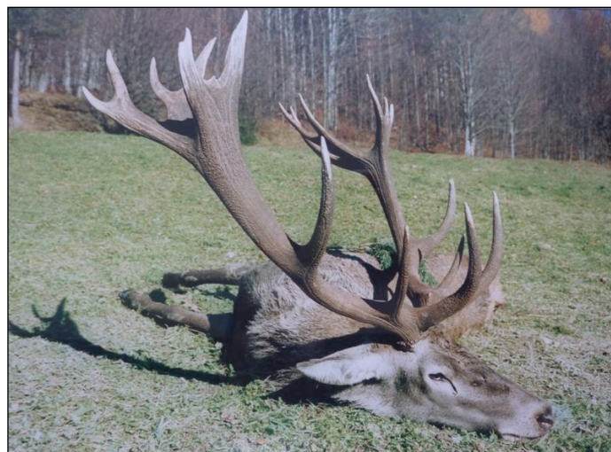
„Ein Jägertraum aus Nordost-Bulgarien!“

Preis- und Programmänderungen vorbehalten.