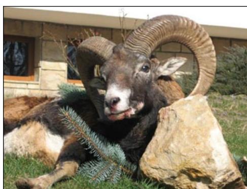
„Muffelwidder kommen in vielen Revieren Bulgariens vor!“

Trophäen mit über 230 CIC-Punkten werden mit 10 % Preiszuschlag berechnet.