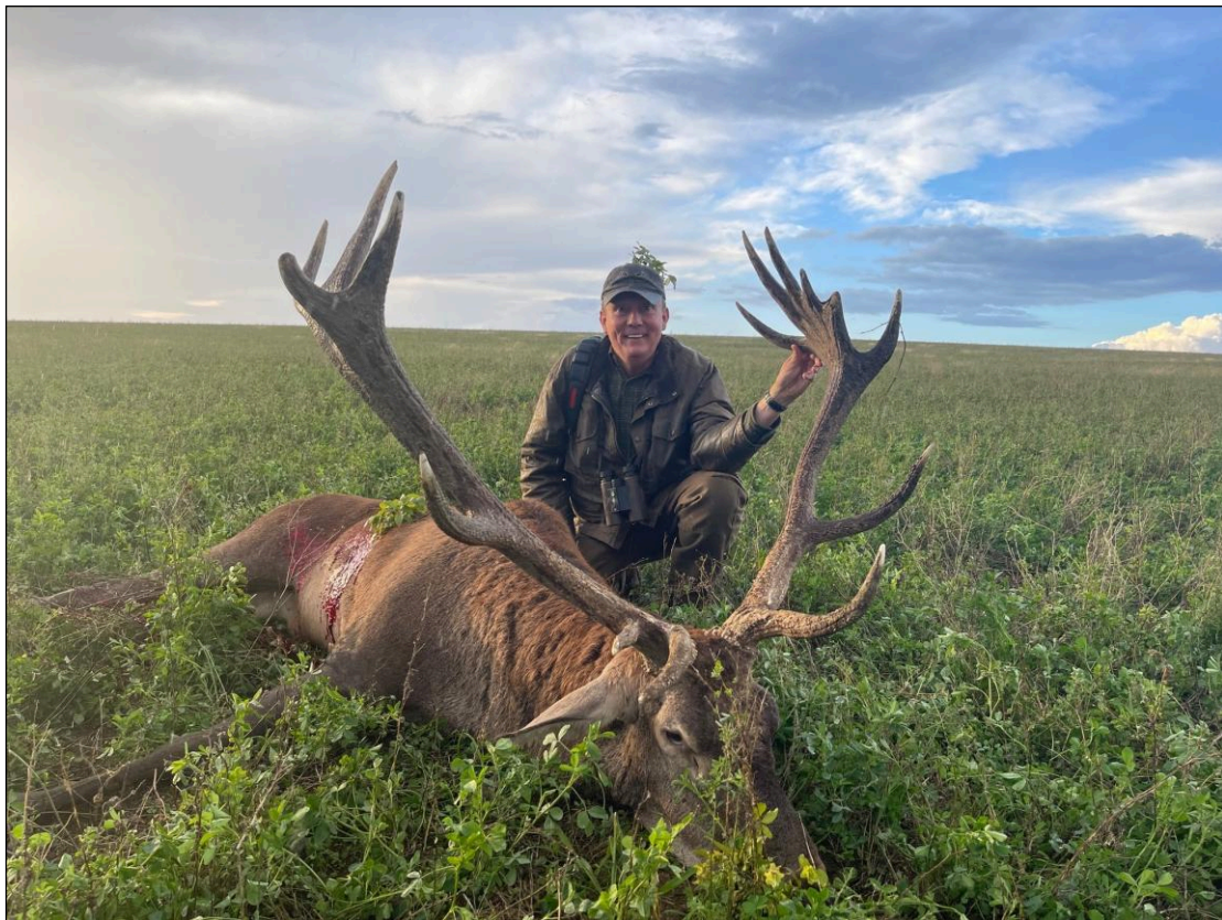
„Hirschbrunft im September – erlegt von einem unserer Stammkunden, 12,85 kg!“

Die Gesellschaft unseres Veranstalters wurde am 2. März 2000 gegründet. Er persönlich begleitet Jagdgäste in Bulgarien schon seit November 1993. Seitdem ist er ständig mit Jägern unterwegs. Aufgrund seiner langjährigen Erfahrung mit der Organisation und mit der ganzen Betreuung von Jagdreisen überall in Bulgarien, hat er diese große Verantwortung übernommen, denn zufriedene Kunden sind für ihn die größte Verantwortung und Pflicht.