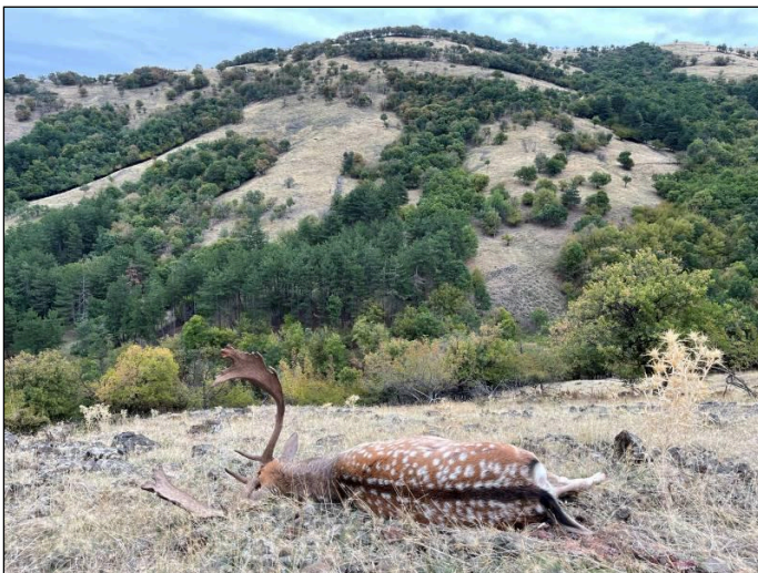
„Damschauer erlegt in den Bergen des Balkan!“