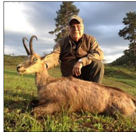
„Der Balkangams ist eine eigene Unterart des Gamswildes!“