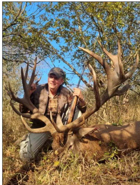
„Für solche Hirsche ist Bulgarien bekannt!“

Weiter werden sie immer aktuelle Information über die Vielfalt und die Verteilung der Wildbestände in den verschiedenen Teilen Bulgariens und über die allgemeine Organisation in ihrem Jagdwesen an die Geschäftspartner im Ausland vorlegen. Das kleine Bulgarien ist mit den qualitativen Trophäen schon weltweit bekannt. Sowohl die Jagd auf Rot-, Reh-, Dam-, Muffel-, Gams- und Schwarzwild, sowie auch auf Raub- und Federwild, konnte entsprechend den individuellen Wünschen der Gäste in mehreren hervorragenden Revieren Bulgariens organisiert werden. Die Referenzen sind inzwischen tausende ausländische Jäger, die durch ihre Erlebnisse bestätigen können, dass die Jagd mit unserm Partner in Bulgarien ein echt positives Erlebnis ist.