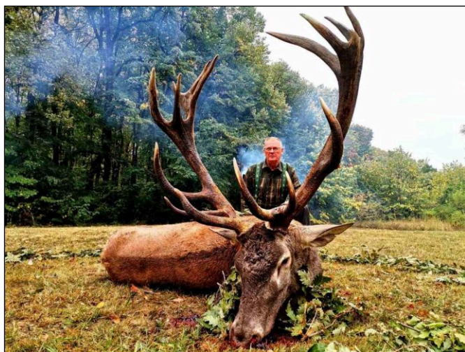
„Traumhirsch weidgerecht zur Strecke gelegt!“