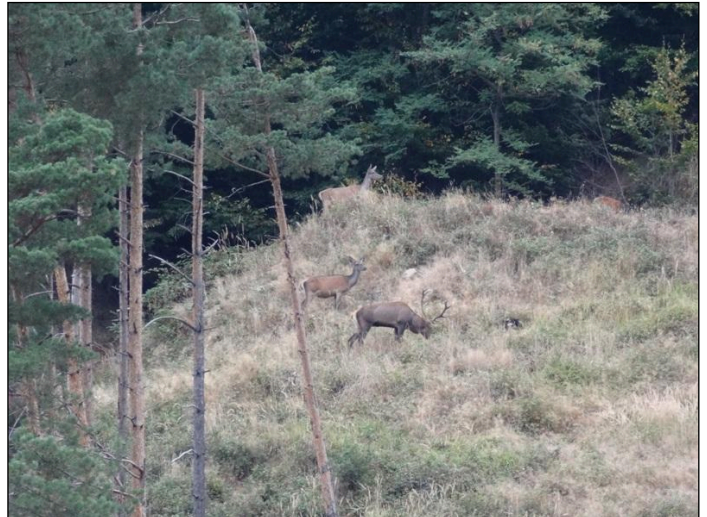
„Das Rotwild auf der Freifläche zur Äsung!“