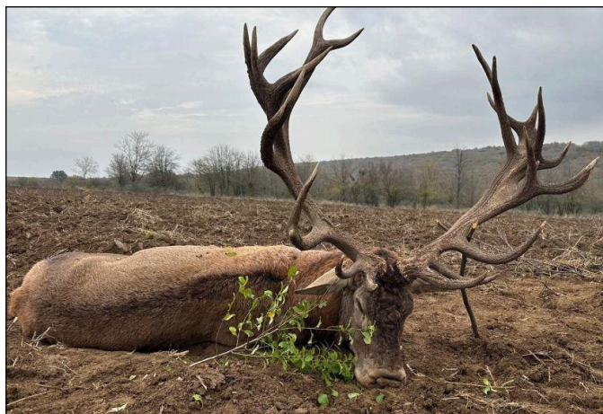
„Gewaltiger Hirsch mit über 13 kg!“