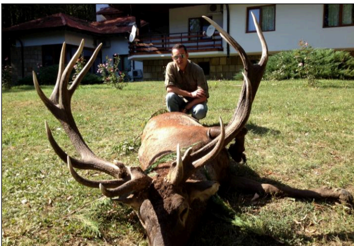
„Kapitalhirsch vor Jagdhaus zur Strecke gelegt!“

Abschussgebühren für die Reviere Zentral-Cherni Lom, Elenovo, Gradishte, Voden, Rossitsa und Kormissosch, auf Anfrage!