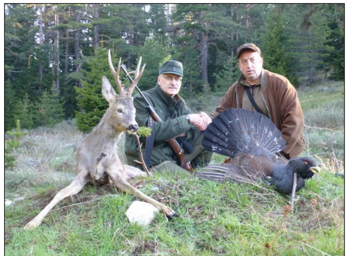
„Ergebnis einer Morgenpirsch auf Auerhahn und Rehbock!“