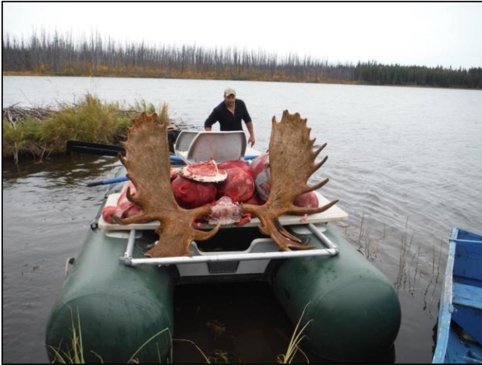
„Trophäe und Wildbret werden geborgen!“

3) Abschussgenehmigungen und Lizenzgebühren werden (sofern nicht ausdrücklich anderes zugesichert wurde) unabhängig vom Erfolg nicht zurückerstattet.