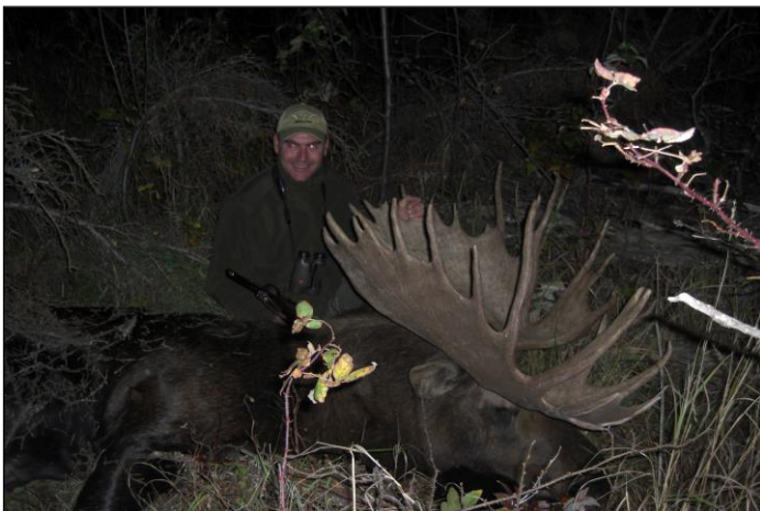
„Unser Kunde A. W. aus Bayern mit seinem Schaufler!“

4) Sämtliche sonstigen für die bestätigte Buchung angefallenen Kosten (z. B. Flugarrangement, Hotel etc.) werden bei Stornierung grundsätzlich in Höhe des Anfalls berechnet. Die Vermittlungsgebühr verfällt in jedem Fall!