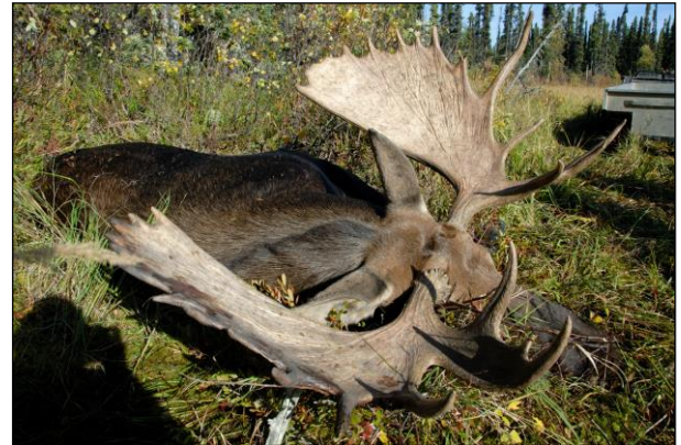
„Braver Elchschaufler sowie sichernder Schwarzbär!“