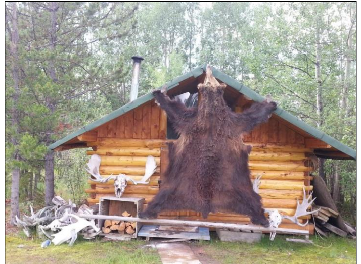
„Urige Jagdhütte im Jagdrevier!“

4) Sämtliche sonstigen für die bestätigte Buchung angefallenen Kosten (z. B. Flugarrangement, Hotel etc.) werden bei Stornierung grundsätzlich in Höhe des Anfalls berechnet. Die Vermittlungsgebühr verfällt in jedem Fall!