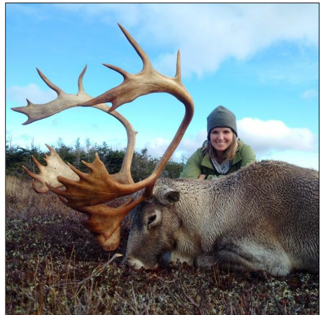
„Unter US-amerikanischen Jägern ist das Woodland Karibu ein „Must-have“!“