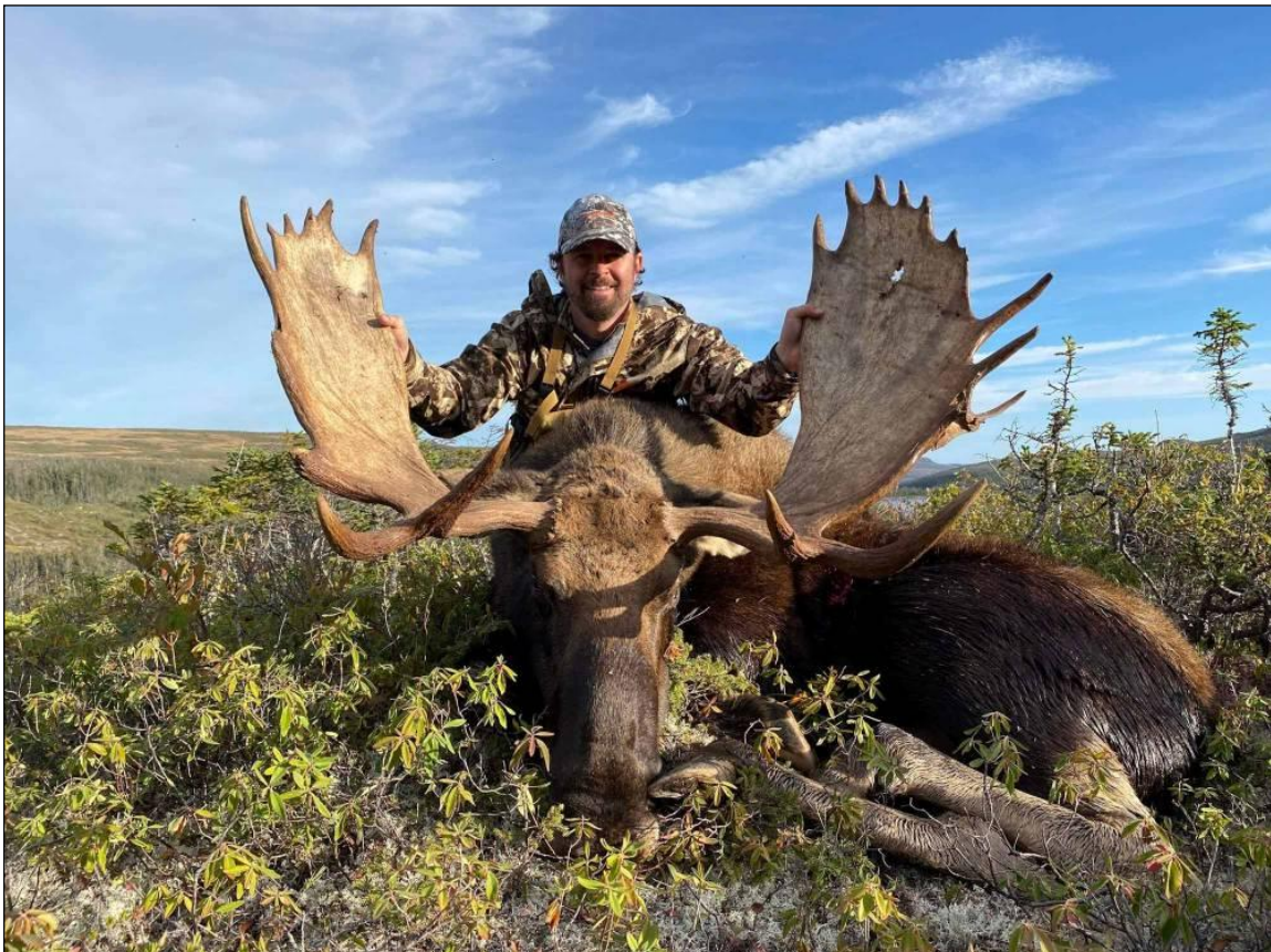
„Dieser Elchschaufler kann sich sehen lassen!“

Unser Outfitter macht selten Werbung. Er veranstaltet einfach erfolgreiche Jagdausflüge in den besten Gebieten für die größten Trophäen und lässt seine Kunden für sich sprechen. Mit idyllischen Orten, komfortablen Camps, die nur mit dem Flugzeug erreichbar sind, und bis zu 12 Elchen pro Quadratmeile sowie den größten Waldkaribus und Schwarzbären, die es gibt, garantiert er Ihnen einen Jagdausflug voller Spannung, Abenteuer und Erfolgserlebnissen!