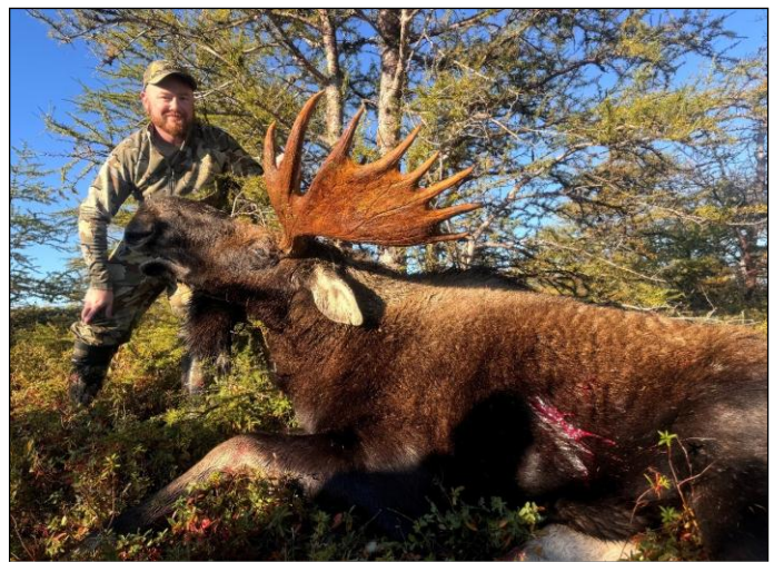
„Neufundland hat die höchste Eichdichte in ganz Nordamerika!“