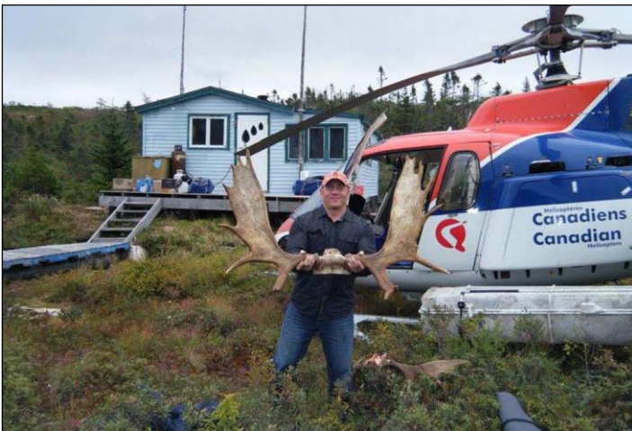
„Der Einflug in die Camps erfolgt mit Helikopter oder Wasserflugzeug!“

Das Skinning, Caping und Ausweiden Ihres Tieres ist in Ihrem Jagdpaket enthalten. Einmal ausgenommen und entbeint, liefert ein Elch etwa 240 Pfund gutes, nahrhaftes Wildfleisch. Sie können das Fleisch mit nach Hause nehmen oder es dort lassen, und es wird gerne an bedürftige Familien dort in der Gemeinde gespendet.