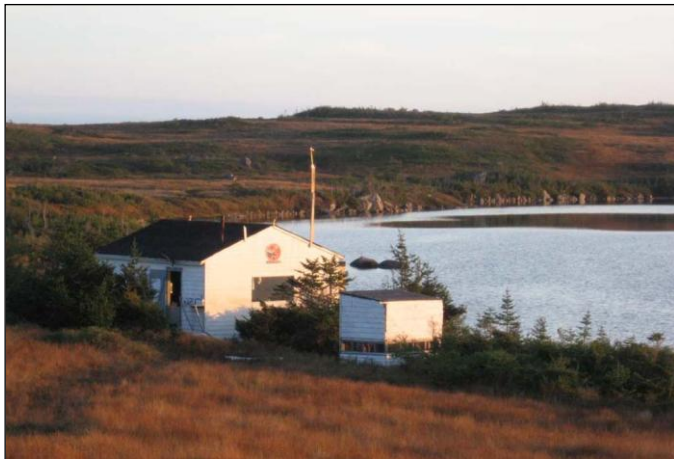
„Der Outfitter betreibt 7 Jagdunterkünfte und mehrere „Spike“-Camps!“