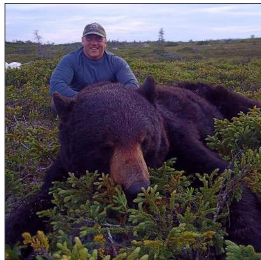
„Die Jagd auf Bären ist eine Kombination aus Ansitz am Luderplatz und Pirsch!“