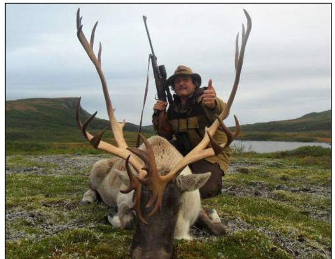
„Das Woodland Karibu kommt nur auf Neufundland vor!“

Die Jagd auf Waldkaribus kann mit der Jagd auf Elche kombiniert werden, und beide Arten können vom selben Camp gejagt werden. Elche halten sich in der Regel in der Nähe von Waldstücken, am Fuße von Hügeln, entlang von Bächen und an bewaldeten Hängen auf. Karibus sind in offenem Gelände, auf kargen Bergrücken und in der Umgebung von Seen zu finden.