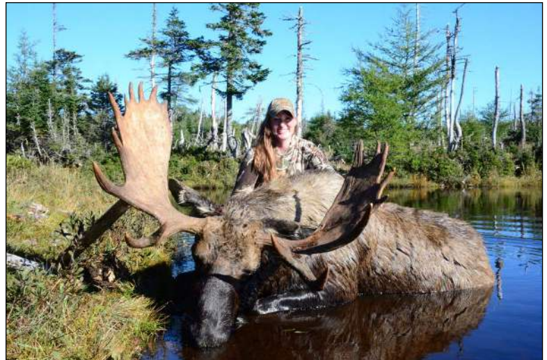
„Die Jagd auf Elche ist vielseitig und findet in verschiedenen Biotopen statt!“

Elche reagieren zwischen Mitte September und Ende Oktober, wenn sie in der Brunft sind, sehr stark auf Rufe. Die Bullen sind zu dieser Zeit ständig in Bewegung, und neue Bullen kommen auf der Suche nach Kühen ständig in das Jagdgebiet. Der genaue Zeitpunkt der Brunft hängt natürlich vom Wetter ab und variiert von Jahr zu Jahr. In manchen Jahren ist die Brunft früh am stärksten, in anderen Jahren später – dies lässt sich nicht im Voraus vorher-sagen.