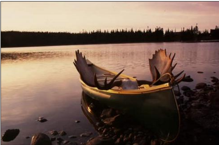
„Erfolgreiches Ende eines gelungen Jagdausfluges!“

Angeschweißt und nicht gefunden gilt als erlegt!