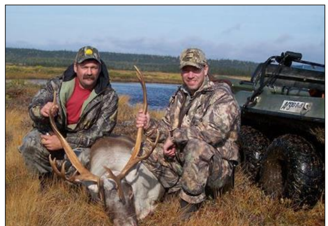
„Wieder ein zufriedener Jagdgast mit seinem Guide!“