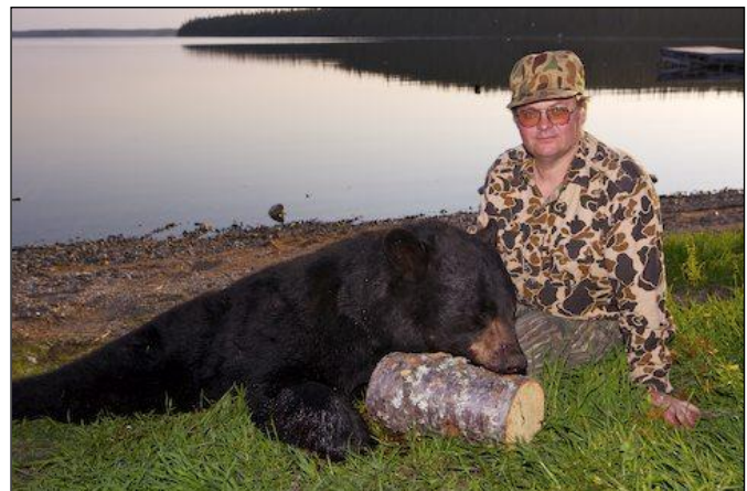
„Braver Schwarzbär am See zur Strecke gelegt!“

Der Elchbestand in Neufundland ist ausgezeichnet. Durch viele Kahlschläge ist das Äsungsangebot hervorragend und reichlich. Die einheimischen Jäger sind weniger an starken Trophäenträgern interessiert, als an der reinen Fleischjagd. Aus diesem Grunde kann der Jagdgast, vorausgesetzt er kommt zur richtigen Zeit, mit einer starken Trophäe rechnen. Richtigerweise muss man sagen, dass der ostkanadische Elch nicht so stark wird wie z. B. der Alaska-Yukon-Elch. Die Trophäen haben eine Auslage von 30 - 52 inch. Die beste Jagdzeit auf den Elch ist zur Brunft ab Ende September bis Mitte Oktober. Eine gute Zeit ist aber auch die Winterjagd im November bis Anfang/Mitte Dezember. Die Elche beziehen ihre Wintereinstände und kommen dann auf die Kahlschläge zum Äsen und können dort sicher angesprochen und relativ leicht erlegt werden. Die Jagdführer sind sehr versiert und wissen ganz genau, wo sich im Spätherbst die Elchbullen konzentrieren.