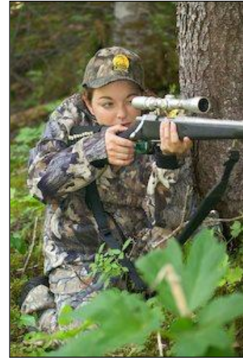
„Junge Jägerin beim Anvisieren der Beute!“