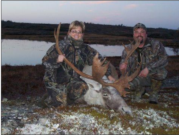
„Auf Neufundland sind die Woodland Karibus heimisch!“