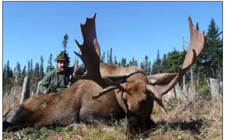
„Während der Brunft stand dieser Elchbulle auf den Ruf zu!“