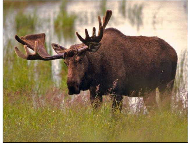
„Die Elche sind hier im August noch im Bast!“