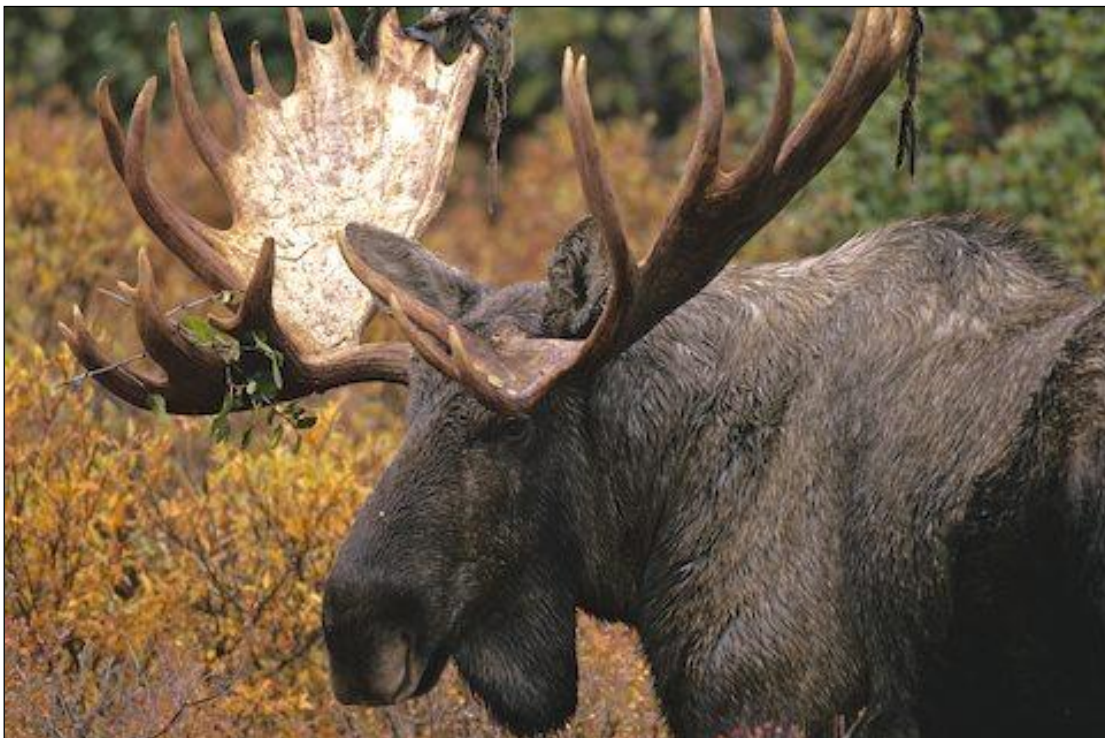
„Starker ostkanadischer Elchschaufler kurz nach dem Verfegen!“

Es ist in Jägerkreisen wenig bekannt, dass in Neufundland sehr starke Schwarzbären ihre Fährte ziehen. Der Schwarzbär wird fast ausschließlich von den einheimischen Jägern bejagt. Aus diesem Grunde ist der Jagddruck nicht sehr hoch, was sich positiv auf die Population auswirkt. Zudem werden die Schwarzbären in Neufundland, bedingt durch optimale Lebensbedingungen (viel Eiweiß/Salmoniden), außerordentlich groß (150 - 350 kg). Die Erfolgsquote auf Schwarzbären beträgt 70 %, auf Elch 88 % und auf Karibu 100 %!