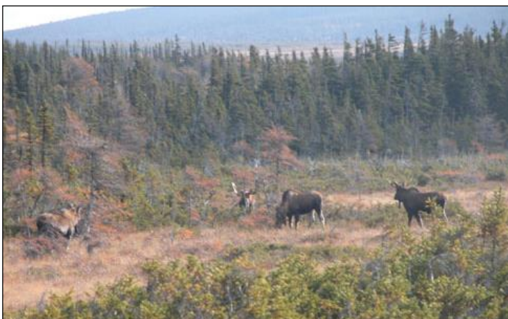
„Neufundland hat die höchste Elchdichte von ganz Kanada!“

Weitere Informationen sowie detaillierte Angebote auf Anfrage! (Auch Flugangebote, evtl. Visum, Hilfe bei Waffen- und Trophäeneinfuhr) Kontaktieren Sie uns!