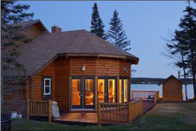
„Ihre gemütliche Unterkunft im Revier!“

Neufundland erhebt auf alle Jagdkosten, Jagdlizenz und Gebühren eine Verkaufssteuer von 15 % (H.S.T.).