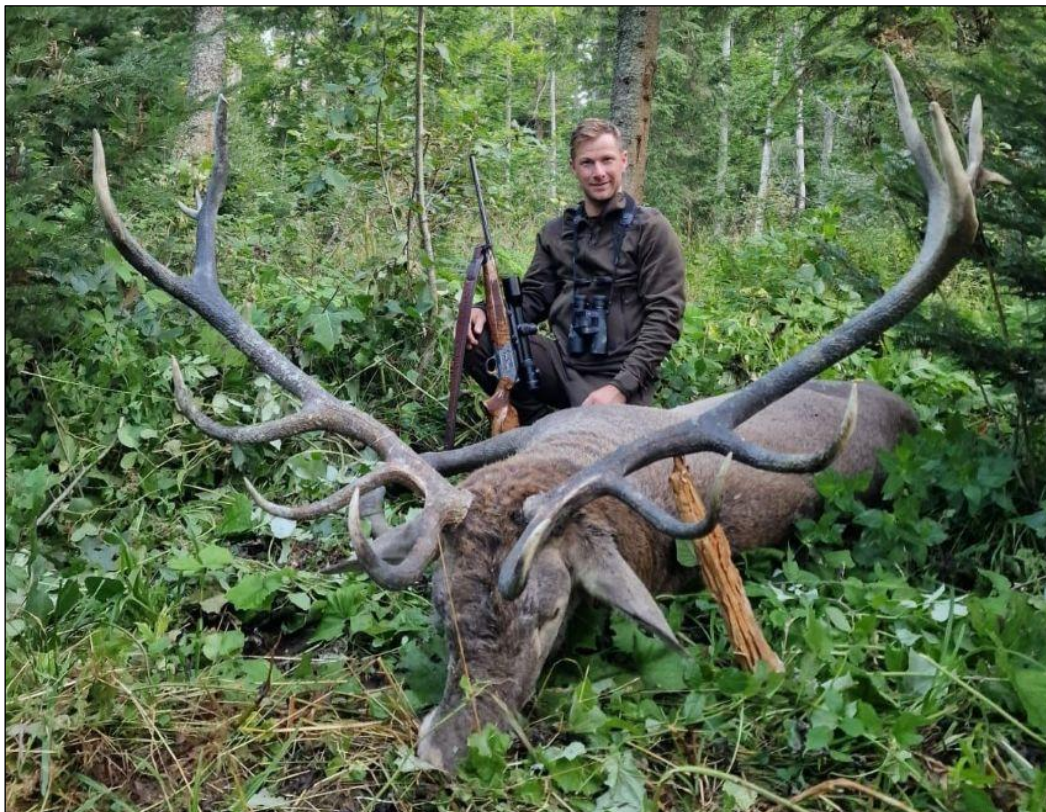
„Braver Karpatenhirsch, erlegt in den Urwäldern von Transsilvanien!“

Unser Jagdveranstalter organisiert, allen Ansprüchen genügend, Jagden von hohem Niveau auf alle Wildarten, die in Rumänien zu finden sind. Die Jagdgebiete liegen in Siebenbürgen, hauptsächlich in den Komitaten Vrancea, Brasov, Harghita und Covasna, wo wir mit großem Erfolg auf Bären, Keiler, Rothirsche, Gämse und auf andere einheimische Wildarten jagen. Unsere Gäste werden vom Fachpersonal des Outfitters begleitet, er teilt mit Ihnen persönlich die Jagderlebnisse.