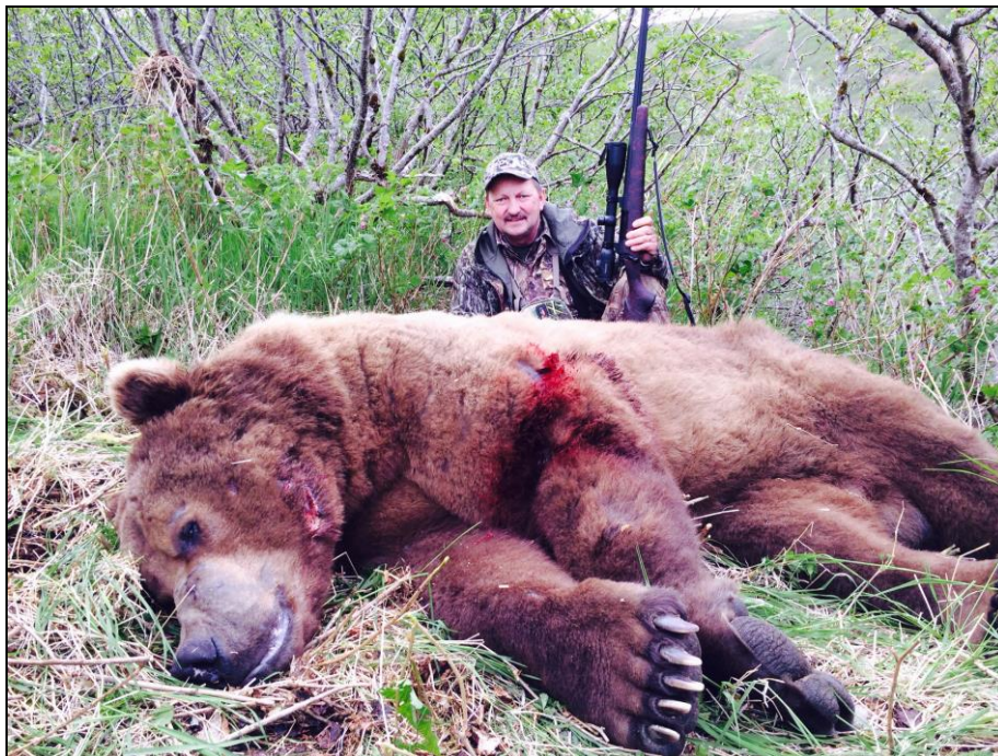
„Diese Braunbären haben schon eine respekteinflößende Größe!“

Transferkosten: Flug von Anchorage nach Sand Point mit Peninsula Airways 918 US$ hin/zurück.