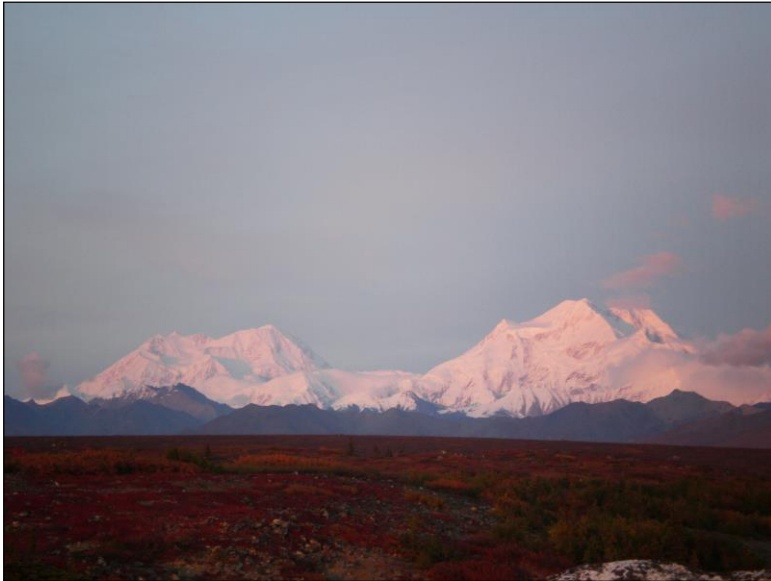
„Auf dem Weg in die Dallschaf-Gebiete!“