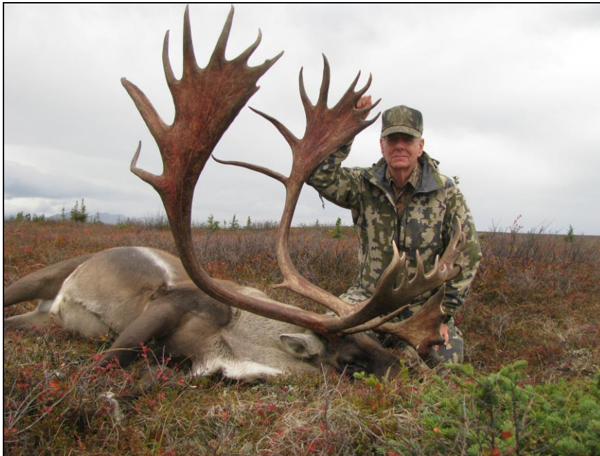
„Rekordbuch-Karibu in der Tundra Alaskas!“

Charterflug von McGrath ins Jagdgebiet mit Tanana Air ca. 920 US$ bei Teilnahme von 2 Personen!