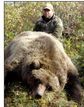
„Elch, Wolf und Grizzly, der Traum jedes Alaska-Jägers!“