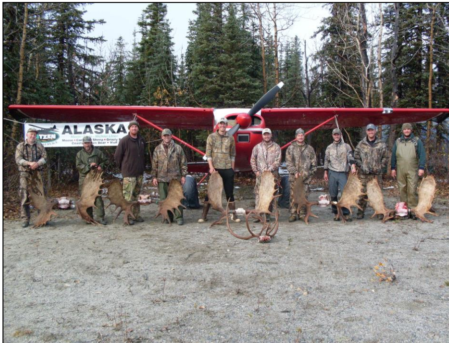
„September 2014: Unsere Elchjäger mit Ihren Trophäen!“