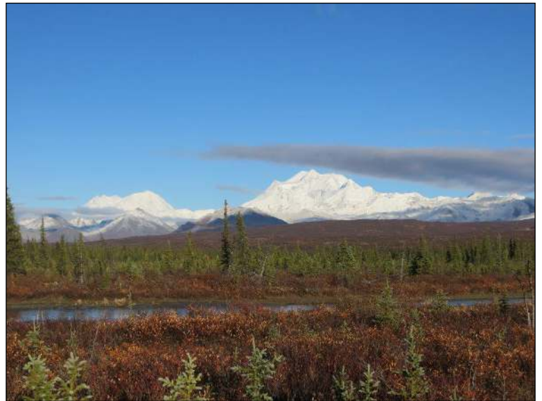
„Unberührte Natur und Berge soweit das Auge reicht!“