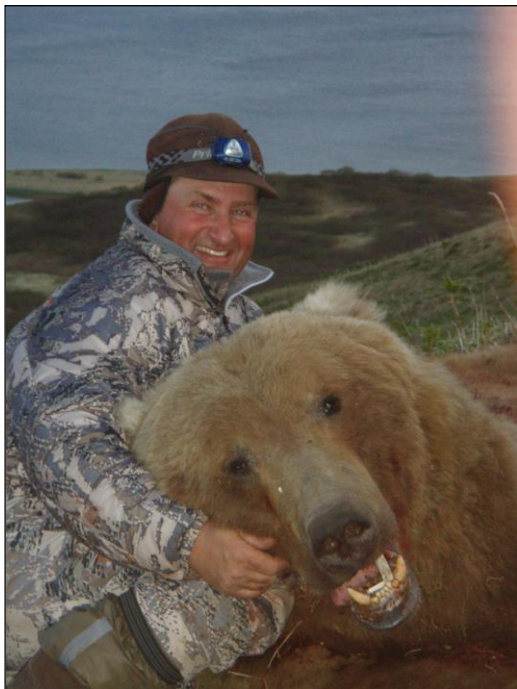
„Küstenbraunbär vom Mai 2014!“