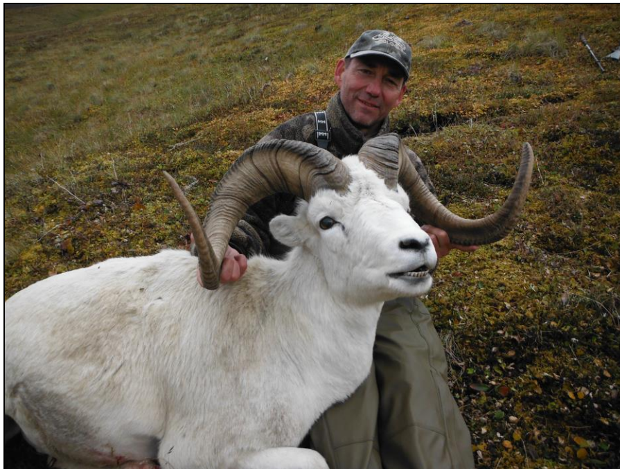
„Traumwider vom Mount McKinley, erlegt im August 2014!“