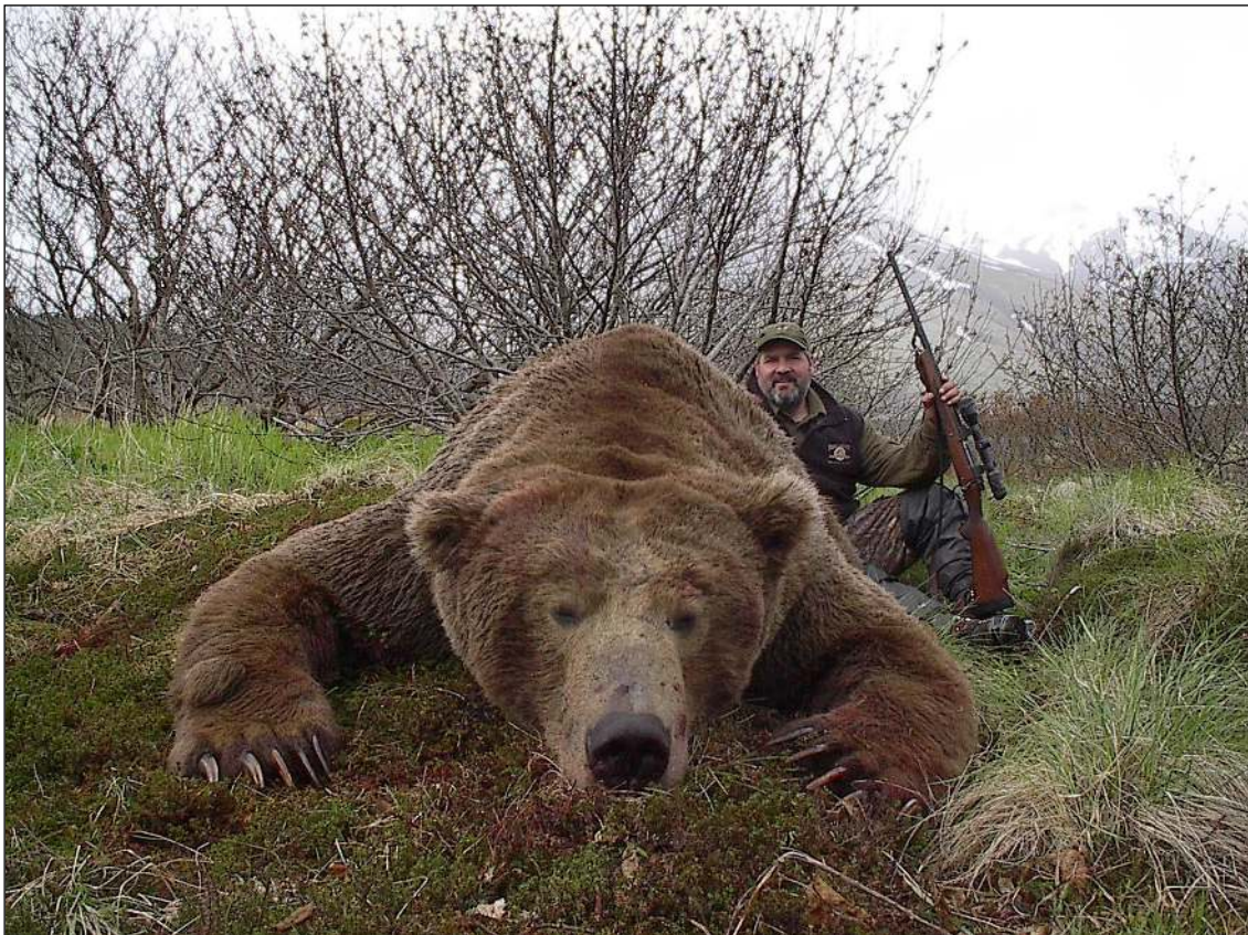
„Monsterbär vor beeindruckender Bergkulisse!“

Die Familie unseres Veranstalters siedelte Ende der 60iger Jahre vom Staat Washington nach Alaska über. Unseren Outfitter beeindruckte es sehr, in diesem großen Land zu jagen, zu fischen und zu fliegen. Mit fast 20 Jahren Buschflugerfahrung ist unser Partner ein sehr erfahrener Pilot. 1980 fing er an Jagdgäste zu führen. Kurz danach gründete er sein eigenes Unternehmen.